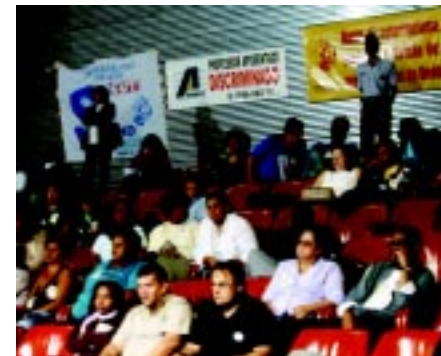
29/09/05 - Audiência Pública na Alesp sobre reajuste salarial