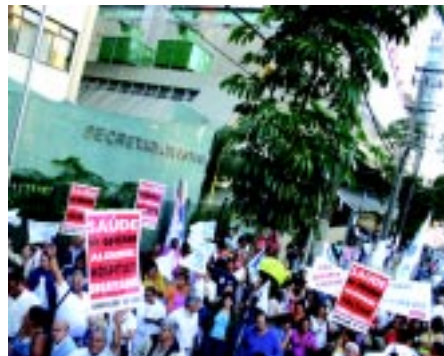
17/06/05 - Passeata no Quarteirão da Saúde da Campanha Salarial 2005