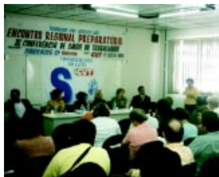
15/07/05 - Encontro regional para a 3ª Conferência Saúde do Trabalhador

Até 10 de fevereiro, acontecem as etapas locais do 8º Congresso. Sua participação é fundamental. Em março, começa a etapa regional.