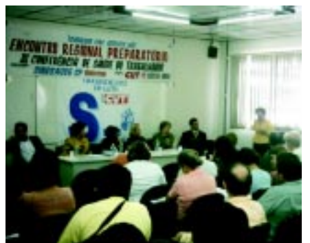
15/07/05 - Encontro regional para a 3ª Conferência Saúde do Trabalhador

Até 10 de fevereiro, acontecem as etapas locais do 8º Congresso.