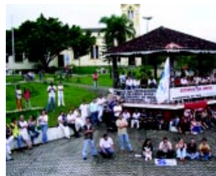
25/10/05 - Ato Público durante greve dos trabalhadores do Consaúde