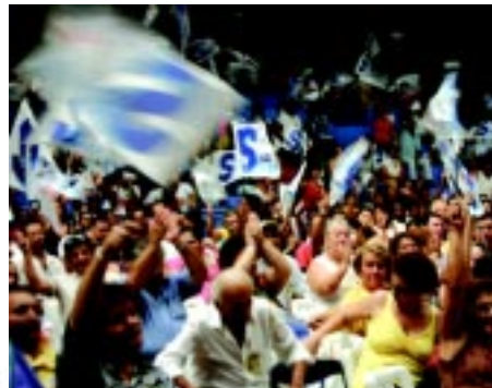
08/04/05 - Assembléia Geral da Campanha Salarial 2005