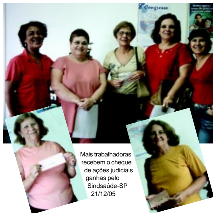
Mais trabalhadoras recebem o cheque de ações judiciais ganhas pelo Sindsaúde-SP 21/12/05