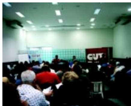
07/10/05 - Conselho de DSB's debate 8º Congresso