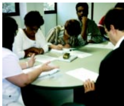
13/06/05 - MPT: espaço de negociação entre trabalhadores e governo