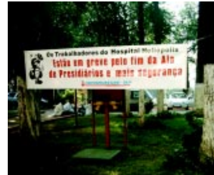
28/07/05 - Greve contra ala de presos no Hospital Heliópolis