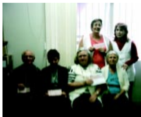
Mai/05 - Trabalhadores recebem o pagamento de ações judiciais ganhas pelo Sindsaúde-SP