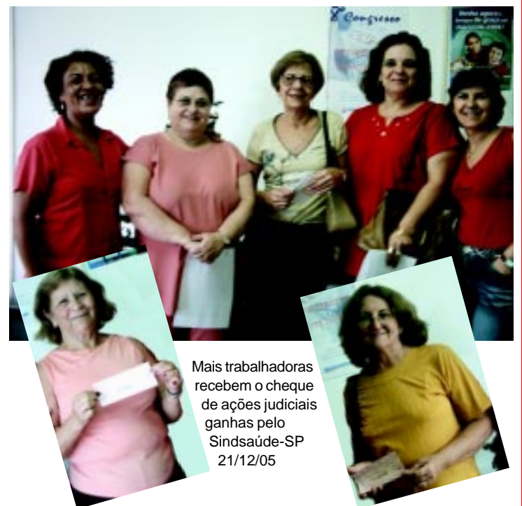
Mais trabalhadoras recebem o cheque de ações judiciais ganhas pelo Sindsaúde-SP 21/12/05