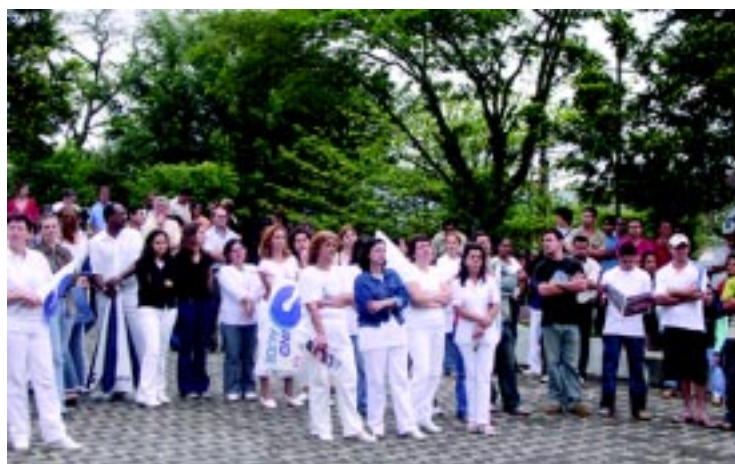
25/10/2005 - Ato dos trabalhadores do Consaúde

Os trabalhadores somente decidiram pela greve ao se esgotarem todas as possibilidades de negociação.