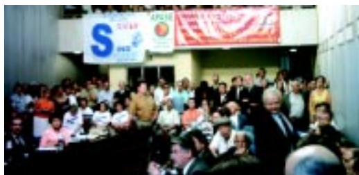
17/11/05 - Audiência Pública na Alesp