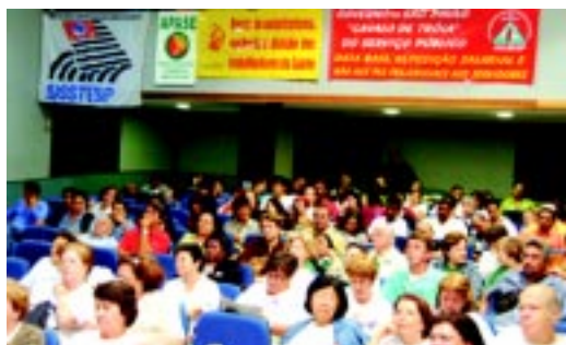
8/11/05 - Jornada de Luta na Alesp

Como a Comissão de Administração Pública não apresentou seu parecer no prazo legal, o projeto foi devolvido à presidência da Assembléia Legislativa e poderá ser votado a qualquer momento.