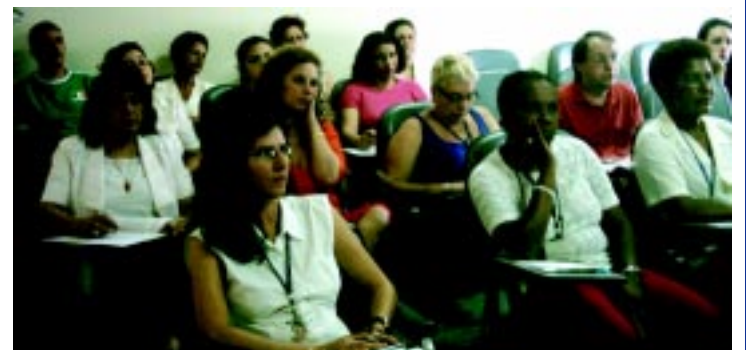
Seminário do Jurídico - Dir II

O seminário busca esclarecer o trabalhador sobre todas essas questões.