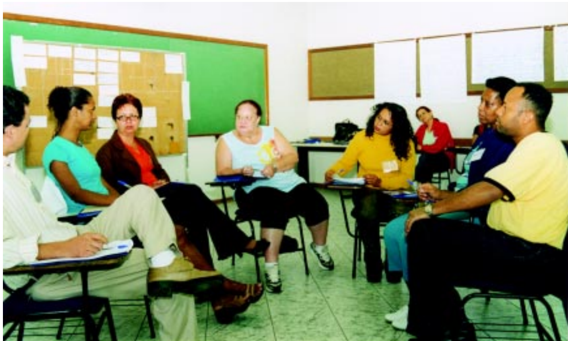
CSBs eleitas debatem estratégias de ação durante um dos cursos de formação realizado em Cajamar

Os trabalhadores públicos organizados têm um papel relevante na defesa do emprego e do acesso democrático aos serviços de Saúde. Cada local de trabalho será um foco de resistência ao rolo compressor de um governo que, na medida do possível, tenta embaçar o olhar do povo, desviando-o das decisões que toma nos gabinetes do Palácio dos Bandeirantes.