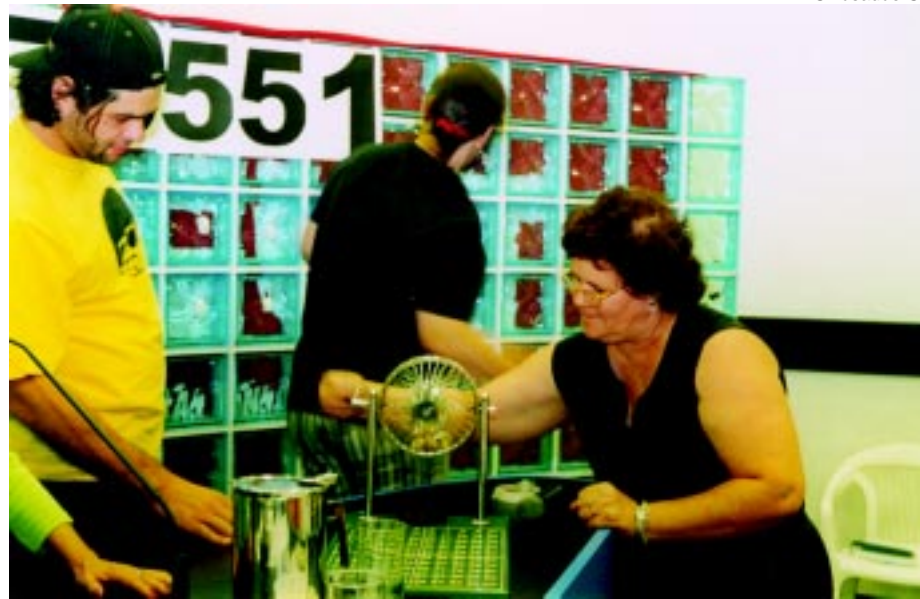
Trabalhadores comandam sorteio das viagens a Porto Seguro (saiba mais, ao lado)