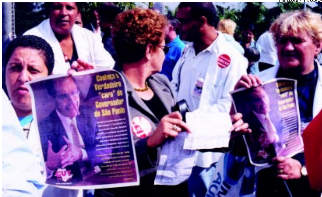
Trabalhadores da Saúde protestam, durante a última greve, em meio à repressão do governo estadual