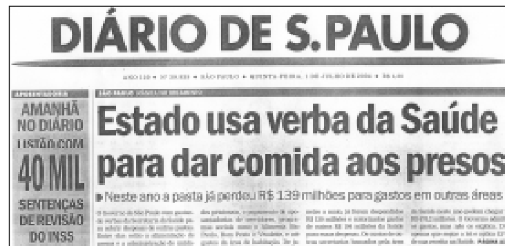
Manchete do Diário estampa manobra do PSDB contra a Saúde

Terrível, desumano e desonesto, já que quem paga é discriminado. Mas não é tudo. Mesmo que não esteja com "lotação máxima", uma OS pode suspender os atendimentos caso conclua que não tem