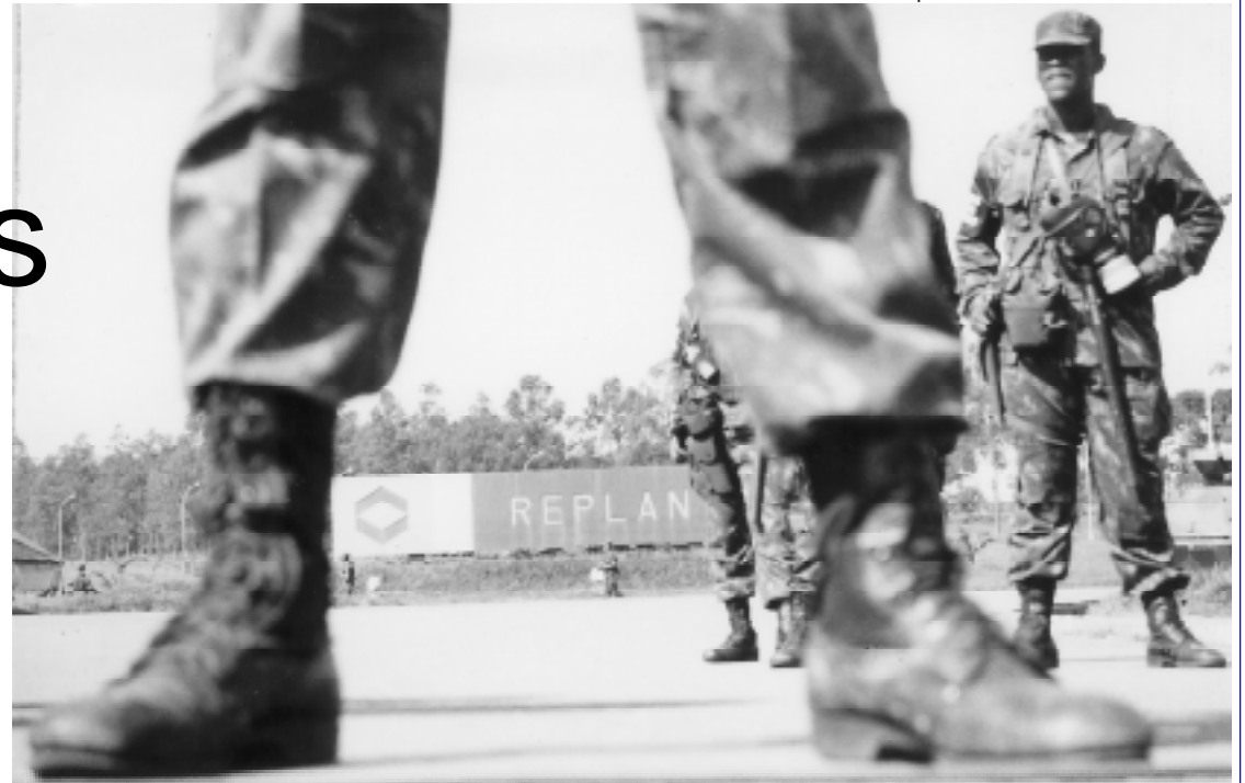
Dois momentos da relação dos tucanos com os trabalhadores: em 95, o Exército invade refinarias e ...

Alckmin mandou cortar nosso ponto e surpreendeu a todos e passou por cima das negociações ao cortar, em ca-