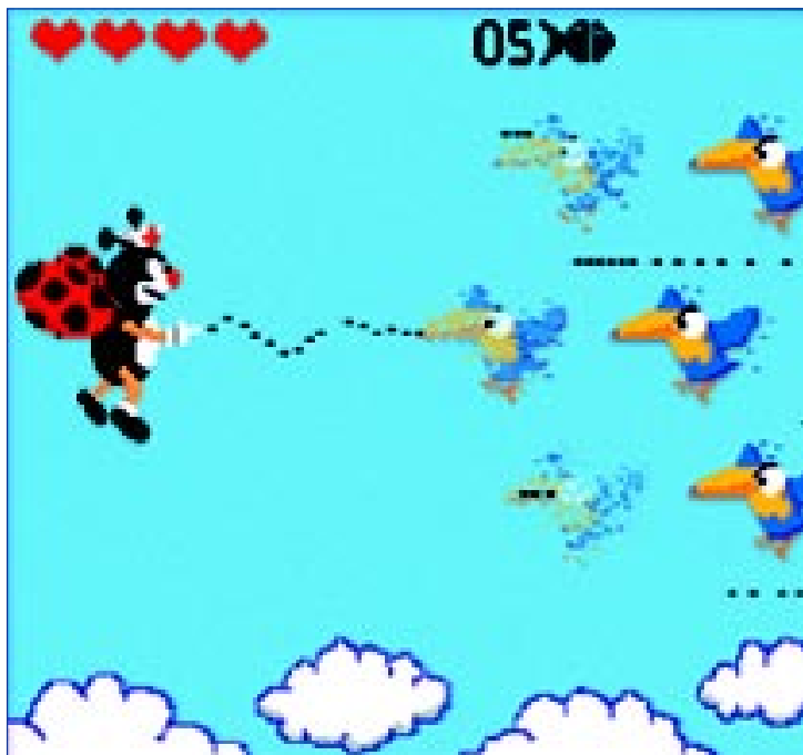
Ilustração de Ramon baseada no jogo digital Space Impact