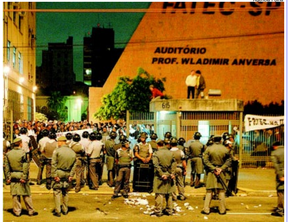
... em maio de 2004 a PM se prepara antes de disparar balas de borracha sobre estudantes e trabalhadores das Fatecs

ráter irrevogável, 100% do Prêmio de Incentivo de mais de 2 mil trabalhadores. Por falar nisso, se dependesse apenas desse mesmo governo, nenhum trabalhador municipalizado receberia o Prêmio de Incentivo, como já acontece na maioria das cidades.