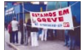
Hospital Regional Sul