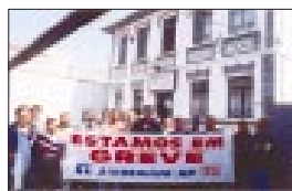
DPE - Sucen