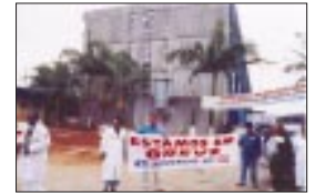
Hospital Geral de São Mateus

Através de imagens de alguns locais que fizeram greve, prestamos nosso reconhecimento a todos