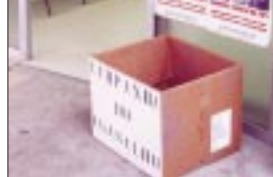
UBS do Pari