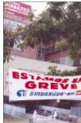
Hospital Geral de Guaianazes