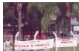
Hospital Luzia Pinho de Mello