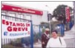
H. Vila Nova Cachoeirinha