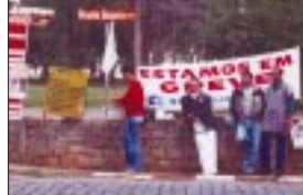
Conjunto Hospitalar do Juquery