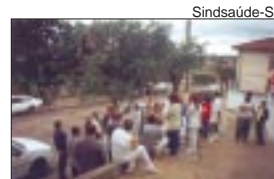
Hospital de Mirandópolis