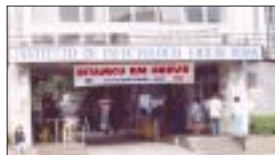
Instituto Emílio Ribas