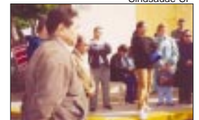
Hospital Geral de Presidente Prudente