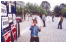
Hospital Geral de Taipas