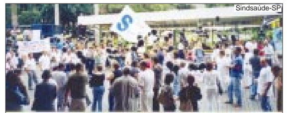
Passeata em Ribeirão Preto no dia 10 de maio