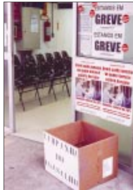
UBS do Pari