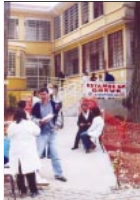
Hospital do Mandaqui