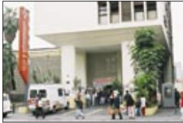
Hospital Pérola Byington