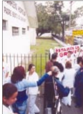
Hospital Padre Bento