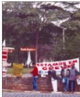
Conjunto Hospitalar do Juquery