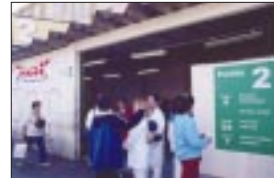
PAM Várzea do Carmo