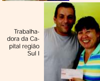
Trabalhadora da Capital região Sul I