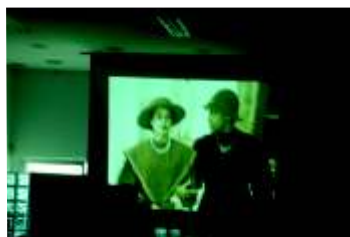
filme sobre história do SUS