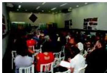
primeira mesa de debates