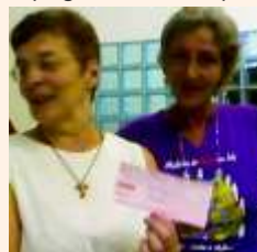
Trabalhadora da Capital região Oeste III

SindSaúde-SP continua fazendo o pagamento dos processos