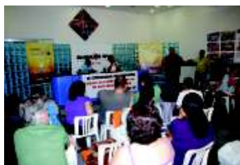
Segunda mesa de debates