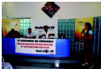
intervenções da platéia

Junto com a Campanha Salarial e o 9º Congresso, os trabalhadores da saúde têm um extenso calendário de atividades permanentes do SindSaúde-SP.