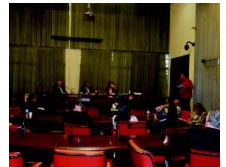
Dia 22/04 Sindsaúde-SP na reunião da Comissão de Saúde da Alesp

Sobre a execução dos exames por empresa privada (CientíficaLab), sem